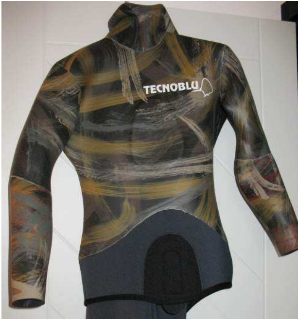
Giacca liscia/spaccata da 5,5 mm. Heiwa SK1