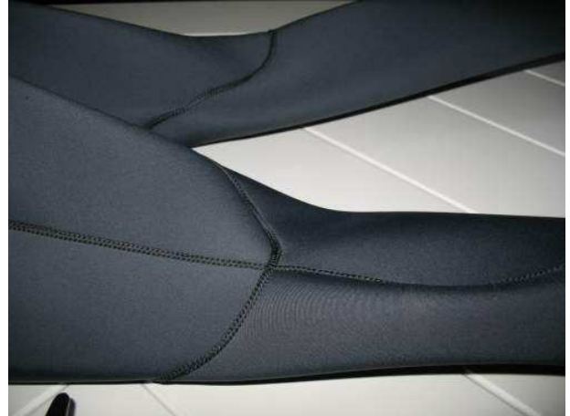
Particolare cuciture pantaloni

I pantaloni confermano la sensazione di cura che mi ha dato la giacca.