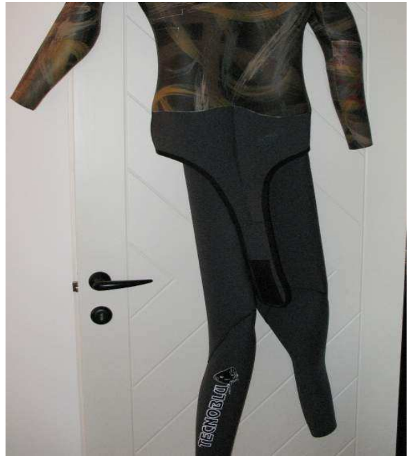
Pantalone foderato/spaccato 5mm.SHEICO

In genere la prima cosa che vado a vedere in una muta su misura sono gli incollaggi, le cuciture e poi le rifiniture estetiche.