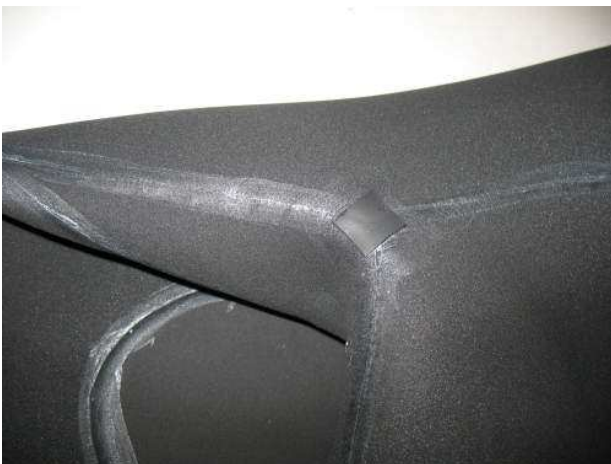
Rinforzo sui punti più a rischio

Dopo un controllo dettagliato posso dire tranquillamente che gli incollaggi sono stati fatti alla perfezione (RINFORZATI NEI PUNTI PIU' SOLLECITATI) con nessuna sbavatura, le cuciture non hanno punti doppi e storti e chiaramente non sono passanti. Le rifiniture sono eccellenti specialmente sugli arti che sono preformati in modo da non creare attriti fastidiosi nel movimento aumentando il confort e la vestibilità.