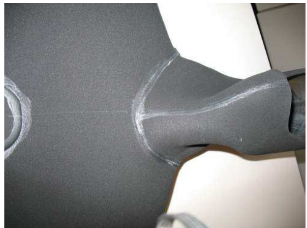
Particolare incollaggi interni