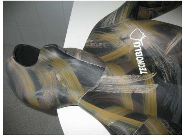
Particolare incollaggi esterni

Le cuciture, come ho detto precedentemente, sono robuste e ben fatte senza creare problemi estetici sul capo.