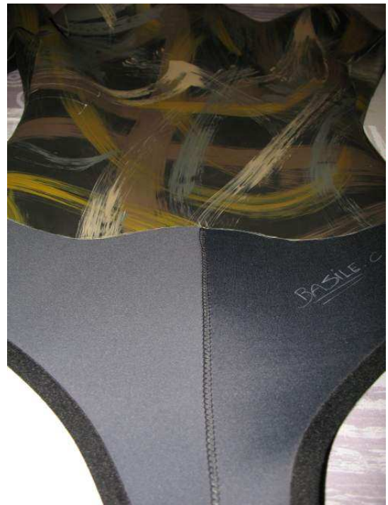
Particolare cuciture Giacca