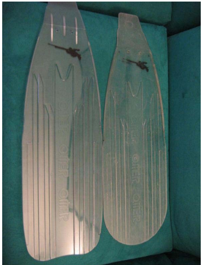
Fig.2 Ice vecchio modello